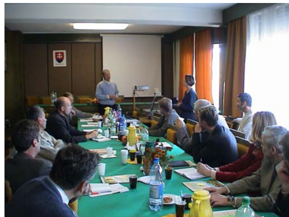
Záujem o výsledky výskumu zo strany farmárov = ocenenie práce výskumníkov!