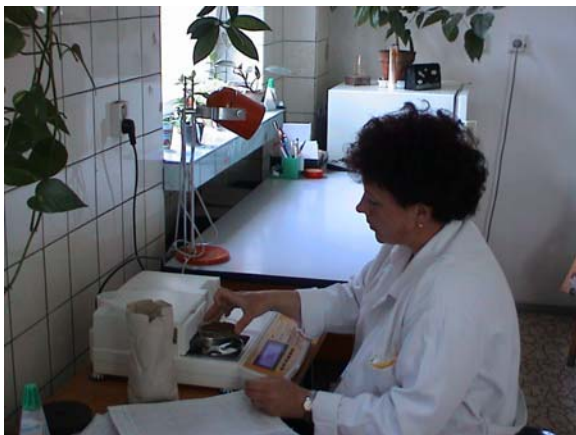
Výskum v oblasti ekologického poľnohospodárstva má na VÚRV Piešťany už niekoľkoročnú